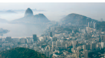
Von Rio nach Johannesburg: Nachhaltige Entwicklung zwischen zwei Erdgipfeln.

In seinem Beschluss vom 11. Dezember 2000 beauftragte der Bundesrat die Ämter, die Umsetzungsarbeiten an den Massnahmen der Strategie 1997 gemäss den Schlussfolgerungen des Zwischenberichtes fortzuführen. Was dies bezüglich einer allfälligen Weiterführung in der Strategie 2002 bedeutet, zeigt die Tabelle im Anhang auf.