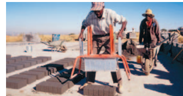
Finanzierung für Entwicklung: produktive Partnerschaften von Staat und Privaten.