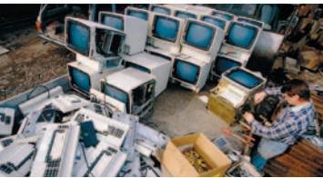
Anreize zur Ressourcenschonung: gezielte Steuerpolitik und vorausschauendes Beschaffungswesen.