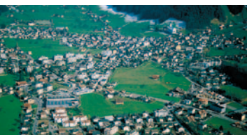
Begehrte Flächen: die Zersiedelung der Landschaft ist nach wie vor ein Problem.