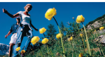
Bewegungsförderung: vorbeugen gegen Herz-Kreislauf- Erkrankungen.

Essensgewohnheiten und Bewegungsverhalten haben einen eminenten Einfluss auf die Gesundheit der Menschen, und gleichzeitig wirkt das Konsumverhalten auf die Produktionsweise der Lebensmittel und damit auch auf die Umwelt zurück. Um im Sinne der Nachhaltigen Entwicklung positive Interdependenzen zwischen den angesprochenen Bereichen zu fördern, stellt der Bundesrat Handlungsbedarf insbesondere zur Vorbeugung von Herz-Kreislauf-Erkrankungen fest. Es gilt, das Wissen über gesunde Ernährung, die Zusammenhänge zwischen Kaufverhalten und Produktionsweisen sowie die Notwendigkeit für ausreichend körperliche Bewegung in allen Schichten der Bevölkerung bekannt zu machen. Um diese Zielsetzungen zu realisieren, unterstützt der Bundesrat das nationale Programm «Gesundheit, Ernährung, Bewegung», das namentlich folgende Aktivitäten umfassen wird: Es soll ein Netzwerk aufgebaut werden, das alle thematisch betroffenen Regierungs- und Nichtregierungsorganisationen einbezieht und sowohl die Abstimmung bestehender und die Lancierung neuer innovativer Massnahmen als auch deren Evaluation ermöglicht. Daneben soll die Bevölkerung intensiv über die positiven Wechselwirkungen von ge-