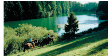
Natur- und Landschafts-parks: wirtschaftliche Grundlage für sanften Tourismus.