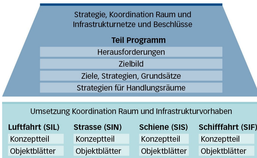
Abbildung 1: Der Sachplan Verkehr besteht aus dem Teil Programm und aus vier Teilen zu den Infrastrukturen Strasse, Schiene, Luft- und Schifffahrt.

Sachpläne sind das wichtigste Planungsinstrument des Bundes. Mit Sachplänen zeigt der Bundesrat, wie er seine Aufgaben in bestimmten Sachgebieten wahrnimmt, welche Ziele er verfolgt und wie er zu handeln gedenkt. Sie unterstützen die Behörden auf allen Stufen dabei, Entscheide zu fällen, die auf einer Gesamtsicht basieren. Sie helfen, raumwirksame Aufgaben des Bundes mit Tätigkeiten der Kantone und Gemeinden zu koordinieren.