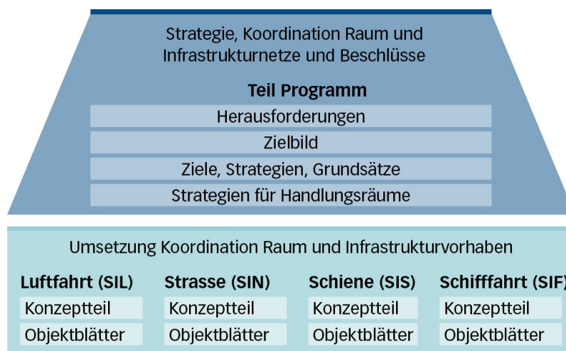
Abbildung 1: Der Sachplan Verkehr besteht aus dem Teil Programm und aus vier Teilen zu den Infrastrukturen Strasse, Schiene, Luft- und Schifffahrt.

Sachpläne sind das wichtigste Planungsinstrument des Bundes. Mit Sachplänen zeigt der Bundesrat, wie er seine Aufgaben in bestimmten Sachgebieten wahrnimmt, welche Ziele er verfolgt und wie er zu handeln gedenkt. Sie unterstützen die Behörden auf allen Stufen dabei, Entscheide aus einer Gesamtsicht zu fällen. Auch helfen Sachpläne, raumwirksame Aufgaben des Bundes mit Tätigkeiten der Kantone und Gemeinden zu koordinieren.