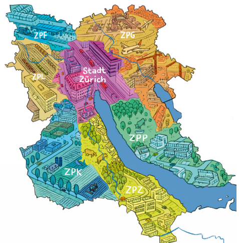
Abb. 1: Gebiet des Planungs Dachverbandes Region Zürich und Umgebung (RZU-Gebiet)