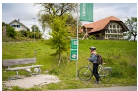
Erlebnisstationen entlang der Veloroute 888

Im Modellvorhaben «Grünes Band» erarbeiten die beteiligten Stakeholder eine integrale Entwicklungsstrategie für den einmaligen Landschaftsraum im Stadt- und Agglomerationsgebiet von Bern. Gleichzeitig konkretisieren sie ihre Zusammenarbeit mit Projekten, wie den Erlebnisstationen, welche in diesem Sommer entlang der Velowanderoute 888 eröffnet werden.