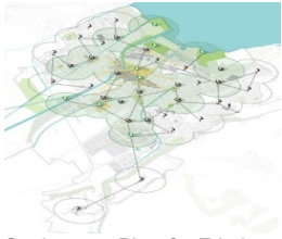
Stadtoasen: Platz für Erholung und Bewegung für alle, in nächster Nähe

Auch im urbanen Raum lassen sich die positiven Auswirkungen von Landschaft und Bewegung für Gesundheit und Wohlbefinden zu nutzen. Das Modellvorhaben von Yverdon-les-Bains setzt bei der Nächsterholung an und zeigt, dass es dafür nicht unbedingt ausgedehnte Landstriche braucht.