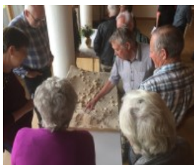
Die Berggemeinde Hasliberg entwickelt ein Generationenhaus

Beim Erfahrungsaustausch des Themenschwerpunkts im März 2021 stand das Generationenwohnen im Zentrum. Das Spektrum der vorgestellten Modellvorhaben reicht von ländlichem bis städtischen Kontext, von konkretem Bauprojekt über organisatorische Massnahmen bis zur Entwicklung eines Wohnungsprototyps.