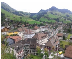
Landschaft als Standortqualität, zugänglich und erlebbar für alle

Château-d'Oex (VD), die grösste regionale Gemeinde im Kanton Waadt, will sich positionieren als Wohnraum und attraktives Touristenziel für ältere Menschen, deren Anteil an der Bevölkerung auch im schweizweiten Vergleich hoch ist. Landschaft und Bewegung spielen in diesem Modellvorhaben in verschiedener Hinsicht eine Rolle.