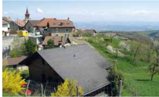
▣ Vallon du Nozon