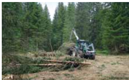
▣ Montagnes Neuchâtelaises

Le pâturage boisé présente un potentiel de bois-énergie important, mal connu et sous-exploité. Le projet s'est attaché à évaluer