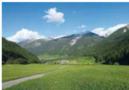
▣ Val Müstair

Le Val Müstair compte environ 40 exploitations agricoles. Le volume d'engrais de ferme disponible (10 000 t/a de lisier et 4500 t/a de fumier