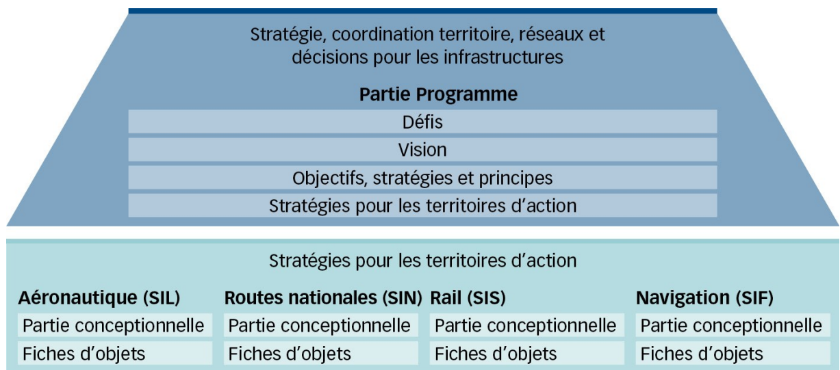
Figure 1: Le plan sectoriel des transports comprend la partie Programme et les quatre parties infrastructurelles route, rail, aéronautique et navigation.

Les plans sectoriels sont pour la Confédération l'instrument de planification le plus important. Dans ses plans sectoriels, le Conseil fédéral montre comment il prévoit d'accomplir ses tâches dans différents domaines, précise les objectifs qu'il poursuit et comment il entend agir. Les plans sectoriels soutiennent les autorités de tous les niveaux amenées lors de la prise de décisions reposant sur une vue d'ensemble. Ils contribuent à la coordination entre les tâches de la Confédération qui ont des incidences territoriales et les activités des cantons et des communes.