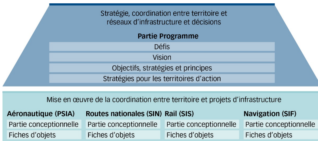
Figure 1: Le plan sectoriel des transports comprend la partie Programme et les quatre parties infrastructurelles route, rail, aéronautique et navigation.

Les plans sectoriels sont pour la Confédération l'instrument de planification le plus important. Dans ses plans sectoriels, le Conseil fédéral montre comment il prévoit d'accomplir ses tâches dans différents domaines, précise les objectifs qu'il poursuit et comment il entend agir. Les plans sectoriels soutiennent les autorités de tous les niveaux afin qu'elles prennent des décisions reposant sur une vue d'ensemble. Ils contribuent aussi à la coordination entre les tâches de la Confédération qui ont des incidences territoriales et les activités des cantons et des communes.