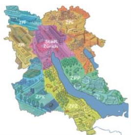
Les sept régions d'aménagement du périmètre RZU.

« La majorité des Suissesses et des Suisses vivent aujourd'hui dans des agglomérations urbaines. Ces espaces fonctionnels continuent cependant d'échapper en grande partie à l'attention de notre système fédéraliste. » Ce constat est tiré de l'article « Unbekanntes Umland » paru dans Espazium , disponible uniquement en allemand. L'auteur du texte, Angelus Eisinger, dirige l'association faitière d'aménagement Region Zürich und Umgebung (RZU) : c'est lui qui a lancé le projet-modèle qui doit élaborer une stratégie de développement intégrale pour la région de Zurich et environs à l'horizon 2050.