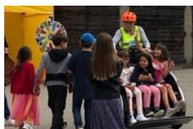
Expérimenter des formes de déplacement différentes : journée de la mobilité du projet-modèle de Milvignes.

Comme Ilanz/Glion (voir ci-dessus), Milvignes résulte de la fusion de plusieurs communes et cherche des solutions pour favoriser une croissance plus étroitement coordonnée. Le projet-modèle de ces trois anciennes communes neuchâteloises met l'accent sur la mobilité durable. Le but est de créer une offre de mobilité coordonnée avec les zones centrales qui soit intégrée à une vision plus large du développement futur de la commune.