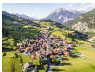
Les régions de Prättigau/Davos et d'Albula élaborent des stratégies communes pour l'habitat.

Le changement démographique pose des défis que les communes isolées ne peuvent affronter toutes seules : dans le projet-modèle de Prättigau/ Davos et d'Albula , dix-sept communes développent ensemble des stratégies pour l'habitat. Des offres résidentielles attrayantes doivent voir le jour dans les régions impliquées : elles miseront sur les forces des diverses communes et tiendront compte de manière intégrale et nuancée des besoins des générations âgées.