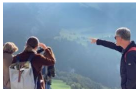
À Ilanz/Glion, des responsables de projet discutent de IntES.

Les instruments d'aménagement communaux et cantonaux classiques se concentrent avant tout sur les questions d'urbanisme et d'infrastructures. Les stratégies de développement intégrales (IntES), en revanche, permettent de tenir compte davantage des aspects sociaux et des « facteurs mous ». C'est ce qu'illustre clairement l'exemple du projet-modèle mis en place pour la commune fusionnée d' Ilanz/Glion .