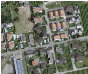
À Terre di Pedemonte, certaines rues de quartier doivent devenir des espaces de voisinage.

Le magazine « Azione » présente trois projets-modèles de la Suisse italienne. L'article met en évidence les aspects participatifs de ces démarches.