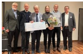
La Fondation generationplus distingue le projet-modèle des Vallées de montagne tessinoises.

En novembre 2021, le projet-modèle des Vallées de montagne tessinoises de Muggio et Onsernone a reçu un « Eulen-Award » (2 e prix) de la Fondation generationplus. Attribuée tous les deux ans, cette distinction met en évidence des projets novateurs et concrets qui améliorent la qualité de vie des personnes âgées. Le projet-modèle se fonde sur une approche intégrale.