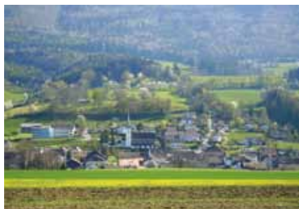
▣ Microregione Haute-Sorne

I sette Comuni giurassiani di Bassecourt, Boécourt, Courfaivre, Glovelier, Saulcy, Soulce e Undervelier (la microregione Haute-