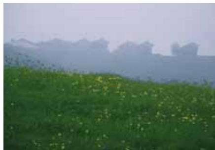
▣ Insediamento walser a Medergen