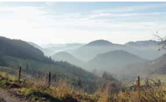
📍 Belchen-Passwang: Chilchzimmersattel

intende di fatto con «qualità del paesaggio»? Avvalendosi della partecipazione di gruppi di interesse e politici locali, regionali e nazionali è stato sviluppato un progetto territoriale per l'oggetto dell'Inventario federale dei paesaggi, siti e monumenti naturali d'importanza nazionale (IFP) Belchen-Passwang. Detto progetto propone aree funzionali con diversi scenari di protezione e sviluppo a livello cantonale che potrebbero caratterizzare la regione inserita nell'IFP nei prossimi decenni.