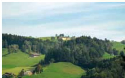
▣ Stalla modello in Appenzello Interno

Delle aziende sempre più grandi, i nuovi sistemi di stabulazione e l'aumento della meccanizzazione del processo aziendale sono alla base del-