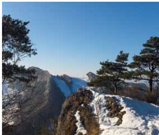
📍 Belchen-Passwang: Chellenhöpfi

Con il suo sostegno finanziario, la Confederazione ha dato incentivi e segnali che hanno motivato le regioni a collaborare, creando nuove reti e strutture di governance e rafforzando la competitività di Comuni e regioni. In tale modo, inoltre, i progetti sono stati meglio accettati.