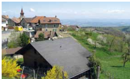
Regione Vallon du Nozon

>> www.adnv.ch/fr/adnv/projets.htm (in francese e tedesco)