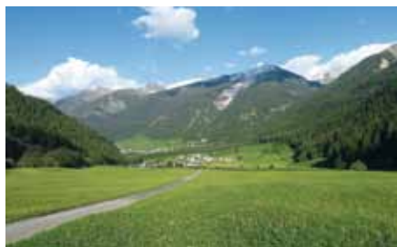
▣ Val Müstair

Nella Val Müstair vi sono circa 40 aziende agricole. La quantità di concimi aziendali disponibili (10 000 t/a di liquame bovino e 4500 t/a di letame bovino) costituisce una buona situazione