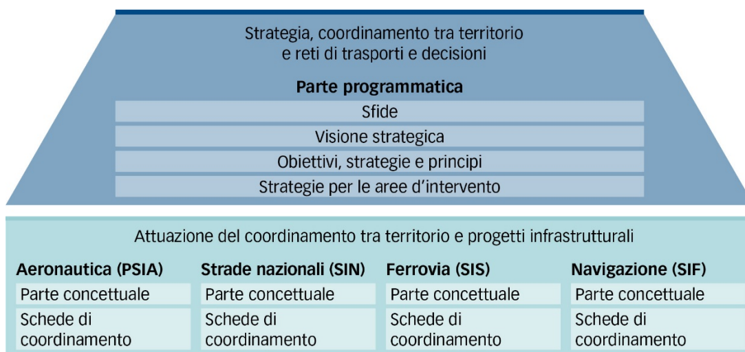
Figura 1: Il Piano settoriale dei trasporti è costituito da una parte programmatica e da quattro parti riguardanti rispettivamente l'infrastruttura stradale, ferroviaria, aeronautica e della navigazione.

I piani settoriali sono gli strumenti di pianificazione più importanti della Confederazione. Tramite i piani settoriali il Consiglio federale mostra in che modo adempie i propri compiti in determinati ambiti, quali sono gli obiettivi perseguiti e come intende agire. I piani settoriali aiutano le autorità di tutti i livelli a prendere decisioni partendo da una visione globale e a coordinare i compiti d'incidenza territoriale della Confederazione con le attività dei Cantoni e dei Comuni.