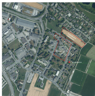
Eine Vielzahl von Wohnblöcken mit 26 Eigentümerinnen und Eigentümern steht im «fliessendem» Grün. Die wichtigsten operativen Orte des Modellvorhabens sind rot umrandet.