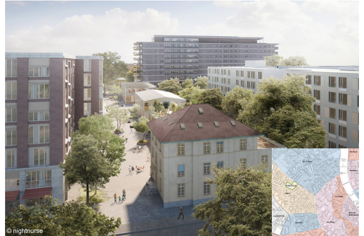
Gesamtansicht des Areals. Im Hintergrund ist das umgenutzte Spitalgebäude ersichtlich

Durch die Schaffung von Gefässen im Rahmen des Netzwerkes Westfeld, welche den regelmässigen Austausch, die Zusammenarbeit und die Mitwirkung fördern, werden Konzepte für das künftige Zusammenleben und -arbeiten im Wohn- und Lebensraum Westfeld erstellt und deren Umsetzung geplant und gewährleistet.