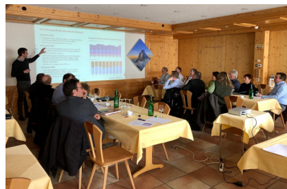
Rückhalt schaffen, Gemeinden, Macher und Partner früh einbinden