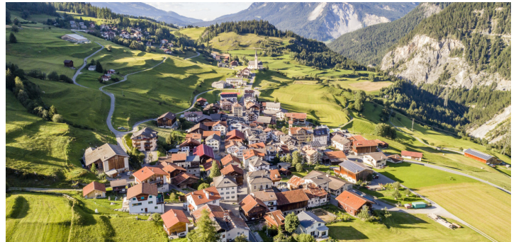
Wohnraumentwicklung als regionale Aufgabe