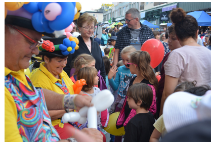
Demografischen Wandel als Chance