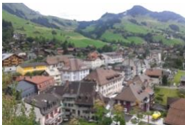
Comune di domicilio e meta turistica: Châteaux d'Oex vuole diventare attrattiva per gli anziani

Gli anziani sono anche al centro del progetto modello di Château d'Oex (VD). Il Comune territorialmente più grande del Cantone di Vaud mira a diventare un Comune di domicilio e una meta turistica attrattiva in particolare per le persone anziane. Un breve filmato dell'Ufficio federale della sanità pubblica (UFSP) mostra in base a questo progetto come la pianificazione del territorio può promuovere la salute, il movimento negli anziani e il ruolo del paesaggio in questo contesto.