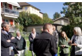
Scambio di esperienze sul tema prioritario, Losanna, ottobre 2021

Come trasformare gli appartamenti in modo che gli anziani possano rimanere a lungo nel loro ambiente familiare anche in condizioni di salute non ottimali? Pro Senectute Vaud e la città di Losanna, insieme alle persone anziane, alle amministrazioni, ai proprietari e ai servizi sociosanitari, stanno sviluppando un approccio innovativo volto a promuovere alloggi e un ambiente di vita che soddisfino le esigenze degli anziani nel quartiere Sous-Gare.