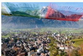
Un'opportunità per il servizio universale: «comunità interconnesse» nel Cantone di Uri

Quali opportunità fornisce la digitalizzazione per il servizio universale nei Comuni dei Cantoni rurali e nelle località isolate? Il progetto modello «comunità interconnesse» nel Cantone di Uri affronta questa domanda puntando sul dialogo tra diversi gruppi d'interesse e i fornitori di servizi. In questo contesto si trattano le esigenze delle diverse generazioni.