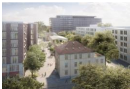
Concepito per situazioni differenti della vita: il comprensorio Westfeld a Basilea

Il progetto modello «Rete Westfeld» a Basilea è uno dei progetti vincitori della valutazione «Top 10 Digital Real Estate» di quest'anno da parte di pom+ e della rivista «immobilia». I progetti di riferimento, i processi innovativi e gli strumenti selezionati mostrano come la digitalizzazione fa progredire l'economia edilizia e immobiliare.