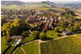
Weinland zurighese: la regione rurale mira a uno sviluppo integrale

Il cambiamento demografico e sociale porta a una trasformazione generale del nostro spazio abitativo e vitale. Ciò si ripercuote sui processi di sviluppo: aumentare le esigenze in materia di pianificazione e organizzazione, per coinvolgere in particolare gli attori dei settori più disparati. In questo contesto acquisiscono importanza i modelli organizzativi integrali, basati su un approccio strutturato in rete, come dimostrato ad esempio dal progetto modello del Weinland zurighese «mis wyland 2040».