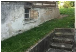
Le conoscenze di tutti i giorni degli anziani sono richieste per la rete di sentieri della regione di Frauenfeld

Come organizzare gli insediamenti per favorire il movimento? Le inchieste svolte nell'ambito dei progetti modello della regione di Frauenfeld e di Yverdon-les-Bains erano rivolte in particolare agli anziani, al fine di identificarne le esigenze specifiche.