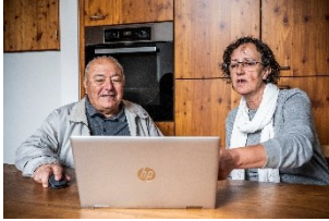
Cinq projets-modèles présentent les opportunités offertes par la transformation numérique pour le service de base. Sur la photo : assistance technique pour les personnes âgées à Monte (TI)

Alors même qu'elle a investi toutes les sphères de notre vie, la numérisation apparaît encore à certains endroits comme un véritable parent pauvre, faute de ressources, parce que certaines peurs freinent l'innovation ou car les besoins ne sont pas pris en compte. Grâce à la numérisation, les communes faibles sur le plan structurel peuvent justement prendre des mesures qui les rendent à nouveau plus attrayantes. Avec les projets-modèles, les communes ont voulu créer un environnement dans lequel des solutions innovantes pour le service de base sont possibles.