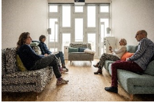
Six projets-modèles s'intéressent à la création de nouveaux espaces pour les personnes âgées. Sur la photo : dans le nouveau quartier bâlois de Westfeld, il est possible de vivre de manière autonome jusqu'à un âge avancé

Comment habiterons-nous demain ? Cette question préoccupe depuis longtemps les communes, les villes et les régions de toute la Suisse. La population suisse s'accroît, la part des seniors augmente et les jeunes quittent les communes situées dans les régions de montagne. Ces changements démographiques exigent de nouvelles formes de logement – en ville comme à la campagne.