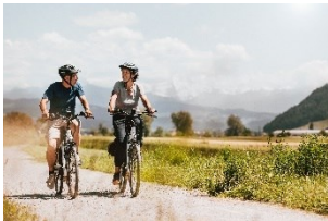
Cinq projets-modèles poursuivent une stratégie de développement globale, adaptée à leur région. Sur la photo : à vélo sur le « Ruban vert » autour de Berne

Une meilleure qualité de vie grâce au développement intégral.