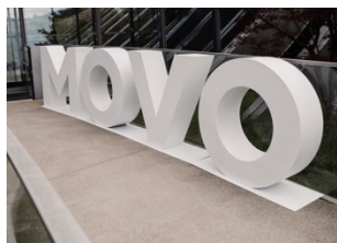
La Confédération continuera à promouvoir les projets-modèles

Souhaitez-vous aussi participer aux projets-modèles de la Confédération ? Le prochain programme débute en 2025. Lors de la Journée de l'innovation, les offices participants ont présenté les axes thématiques qui traitent peut-être d'un sujet qui vous préoccupe particulièrement.