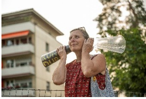
Sept projets-modèles ont trouvé comment explorer le potentiel de leur paysage. Sur la photo : en pleine promenade sonore à Dietikon (ZH)

Prairies luxuriantes, forêts majestueuses, montagnes imposantes et lacs cristallins : autant d'images qui nous viennent à l'esprit lorsque l'on pense au paysage. Mais ce mot est bien plus que cela : il renvoie aussi à notre conception de l'espace, à notre façon de l'appréhender et de l'habiter. Le paysage est l'endroit où nous vivons, travaillons et passons notre temps libre. Pourtant, au quotidien, bien des choses nous échappent. Pour rendre visibles les trésors naturels et culturels d'une région, le développement doit être adapté au paysage.