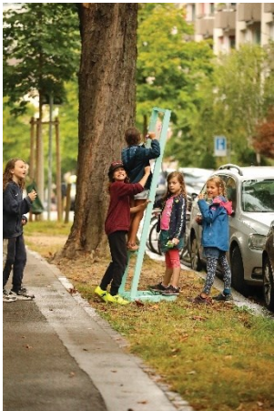
Huit projets-modèles créent de nouveaux chemins et des espaces ouverts pour la population. Sur la photo : aménagement d'une zone de rencontre à Berne

Favoriser les courtes distances, l'activité physique et la santé. Plus l'urbanisation se développe vers l'intérieur du milieu bâti, plus l'espace extérieur gagne en importance. Les huit projets montrent différentes manières de faire évoluer les rues et places en lieux propices à l'activité physique et aux rencontres, voire en aires de jeux pour les enfants et les jeunes.